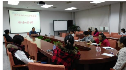
(图、文: 系统部 陈进)

交流是短暂的、精神是永恒的,感谢柳老师为我们提供了宝贵的精神食粮,为我馆今后的发展起到了推动作用。