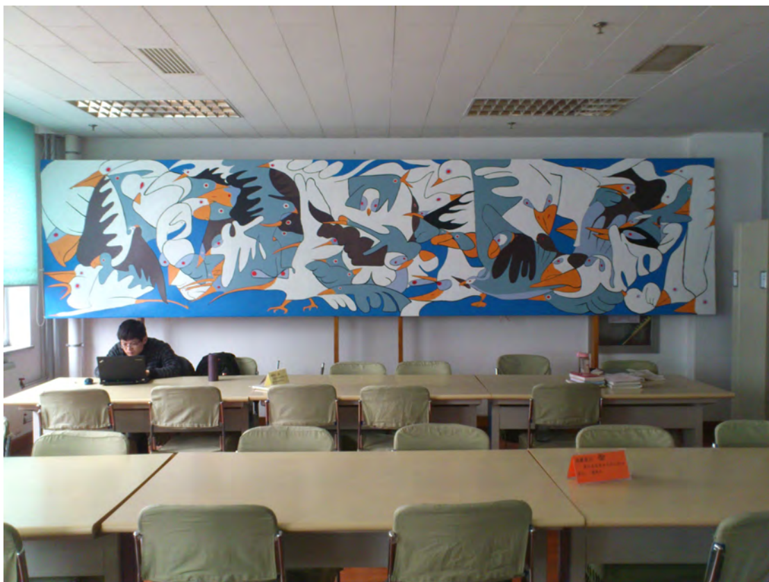
摆在新书阅览室的作品

再一次的谢谢大家给我提供了一个展现的舞台，再一次的感谢给我提供帮助的朋友。（图、文：咨询部 黄坚）