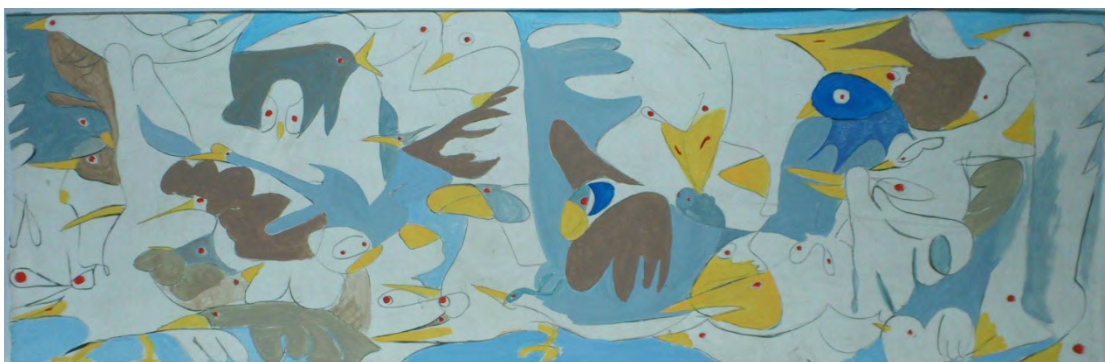
局部放大的色彩推敲小稿