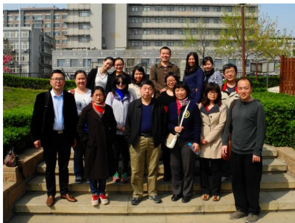
(图、文: 系统部 王鹤)

通过这次“踏青访古”活动, 会员们不仅放松了身心, 缓解了平日工作生活所带来的紧张压力, 而且了解了元大都的相关知识, 欣赏了海棠盛放的美景。“一年之计在于春”, 相信会员们今后会以更加饱满的热情投入到工作岗位中去, 为首都医科大学的发展贡献出自己的力量!